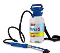
AIR FORCE 3

Pompa per il caricamento manuale di additivi condizionanti, quali antincrostanti, anticorrosivi, risananti, protettivi, anticongelanti negli impianti di riscaldamento tradizionali o sottopavimento. Completa di attacchi e riduzioni - Capacità serbatoio 3 lt. - Prex 3 bar - Peso 2 kg - Dimensioni 15x37 cm.