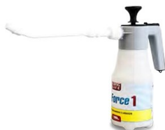
AIR FORCE 1

Pompa manuale per il caricamento impianti termici e la pulizia della camera di combustione delle caldaie a condensazione. Pompa a pressione per il caricamento dei condizionanti negli impianti termici e la pulizia di camere di combustione nelle caldaie a condensazione. Da utilizzarsi con il Boiler Cleaner Economix e il Long Life 100. Completa di Kit raccorderia per defangatore MiniMag - Prex max a serbatoio pieno 2 bar - Materiale pp - Capacità serbatoio 1 lt.